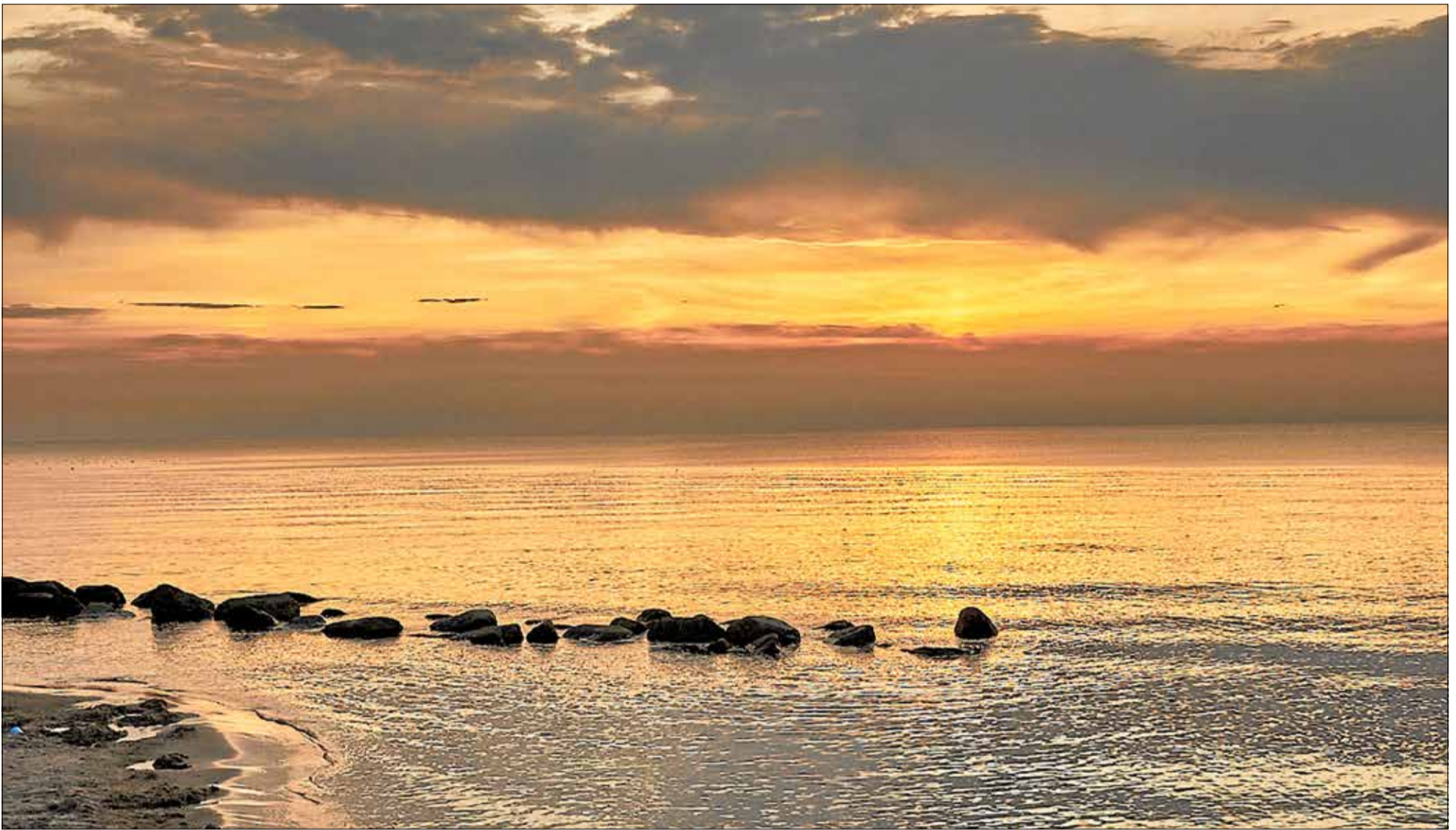
'Mine stillesteder' af Peter Olesen er lige udkommet. Billedet her er fra Vejby Strand.