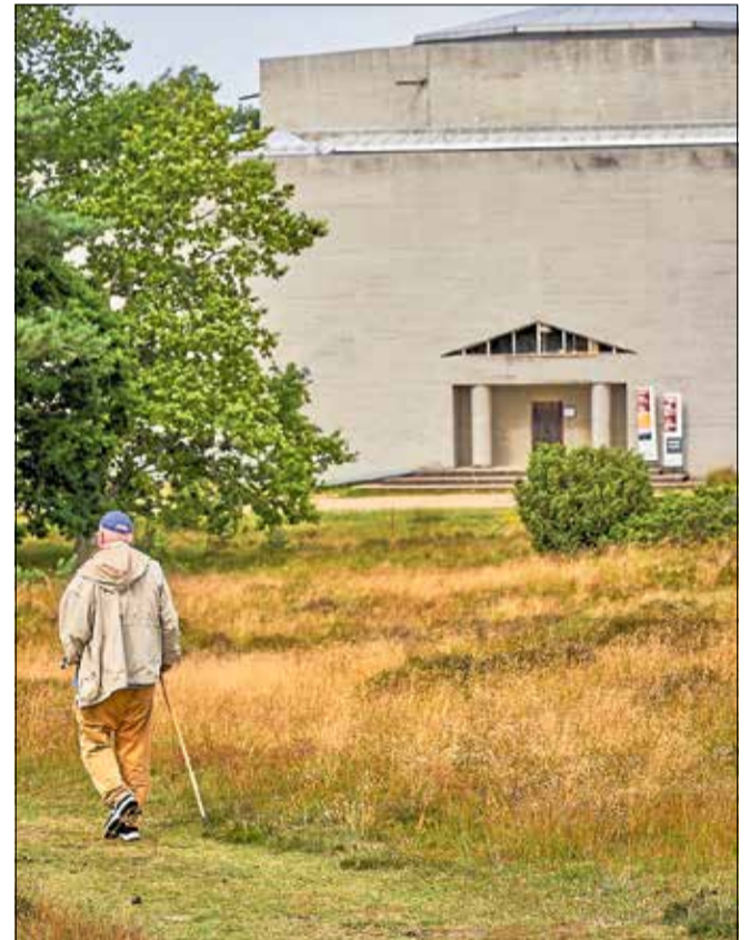
Tegnernes Museum og Statuepark er et af de steder, forfatteren holder af.

- Der er en grund til, at jeg købte sommerhus i Vejby Strand, da jeg havde boet i København i 20 år. Det er blevet mit helle. Også flere andre steder i Gribskov Kommune nævnes i bogen, herunder området Rusland ved Rudolph Tegnernes Museum, hvor han gerne tager sine