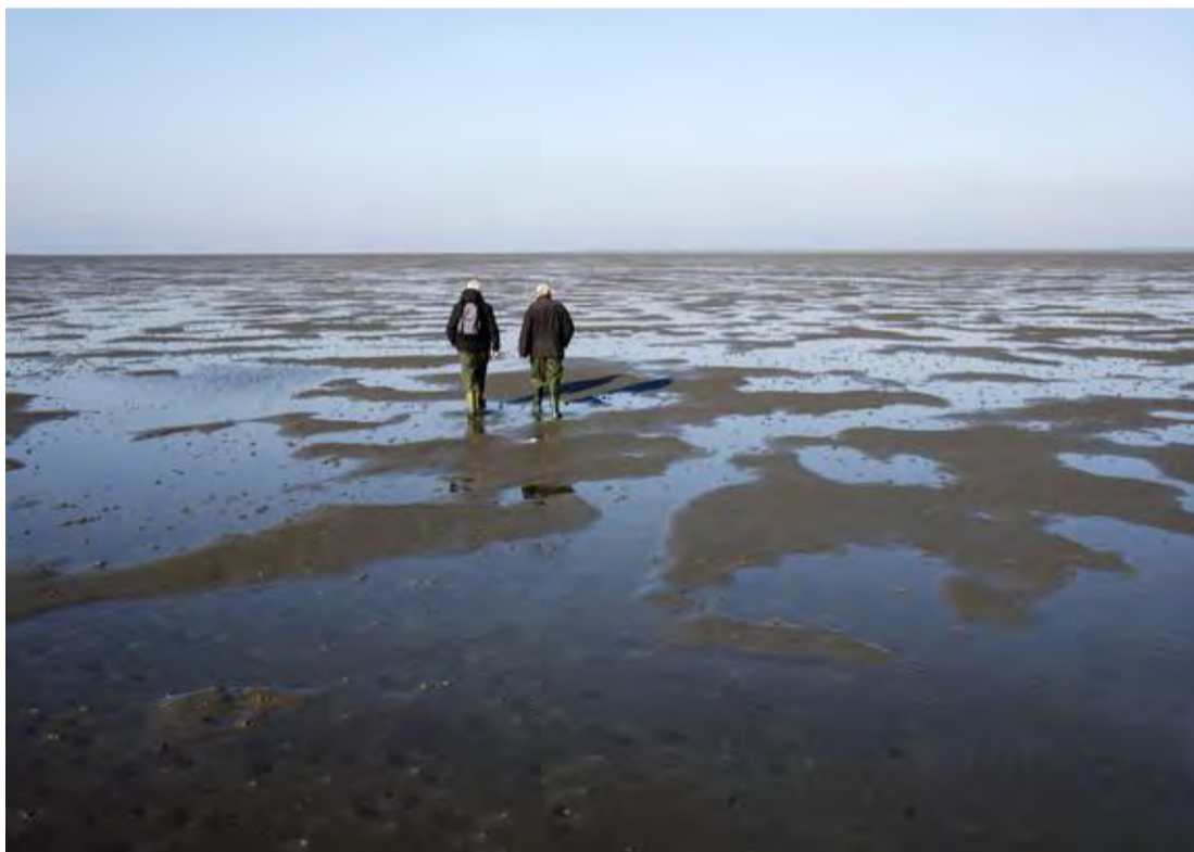
ØSTERSFRED. Vadehavet er ikke alene en stor og fredfyldt naturoplevelse; man kan også høste og spise østers, men pas på tidevandet.