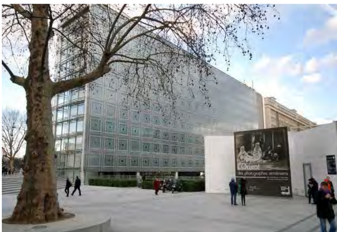
PARISERFRED. Det arabiske kulturinstitut i Paris, Institut du Monde Arabe, ligger i Jardins des Plantes-kvarteret ud til Seinen og øen Île Saint-Louis. På tagterrassen kan man ikke høre byens larm, men nyde udsigten og roen.